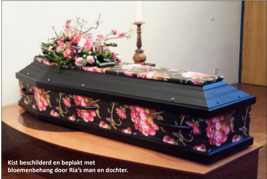
Kist beschilderd en beplakt met bloemenbehang door Ria's man en dochter.