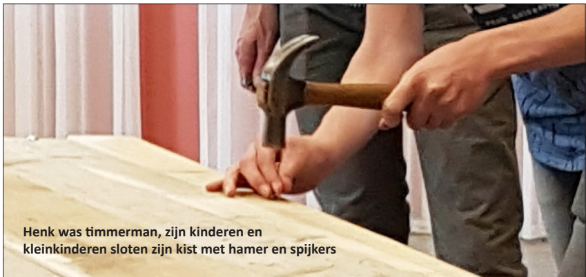
Henk was timmerman, zijn kinderen en kleinkinderen sloten zijn kist met hamer en spijkers